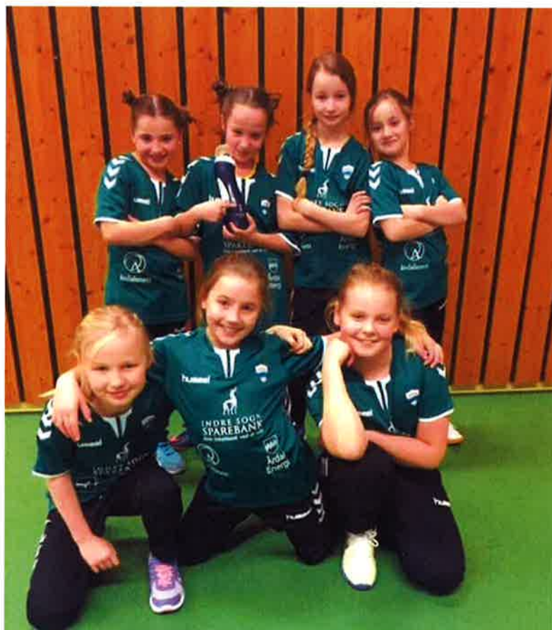
Fornøgte jenter som deltek på minihandballturnering.