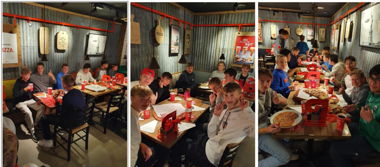
Ei helsing frå J-15: