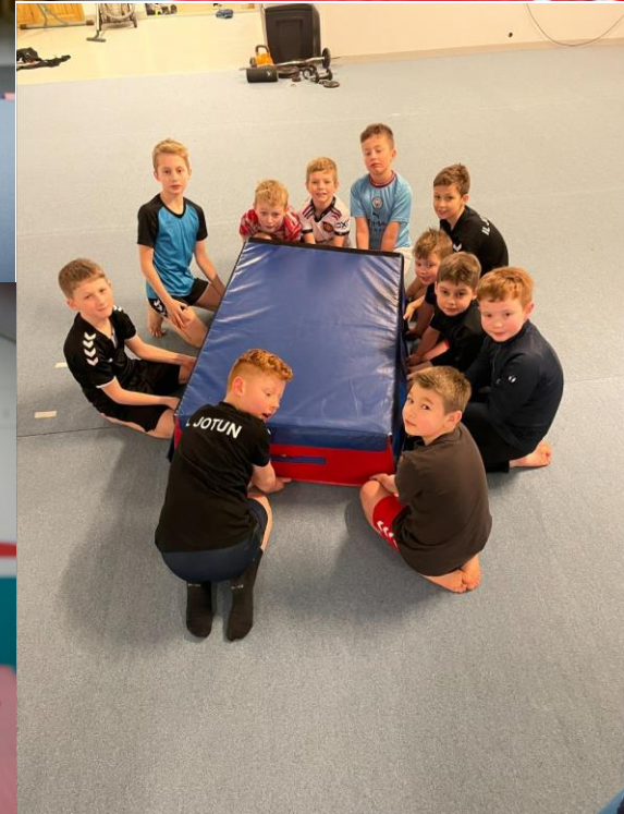
GLIMT FRÅ TRENINGAR OG OPPVISNINGAR